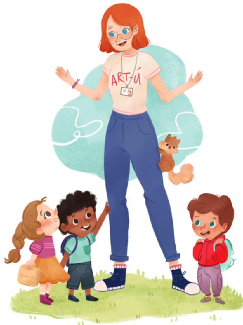
Illustrazione di Federica Berto @bertofederica_illustration.

Il QR code vi permetterà di accedere alle pagine dedicate del nostro sito con il catalogo completo dell'offerta didattica; da ogni scheda sarà possibile compilare un form per richiedere ulteriori informazioni o un preventivo per la vostra uscita.